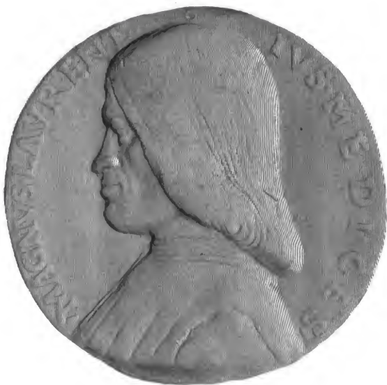
LAURENT LE MAGNIFIQUE.